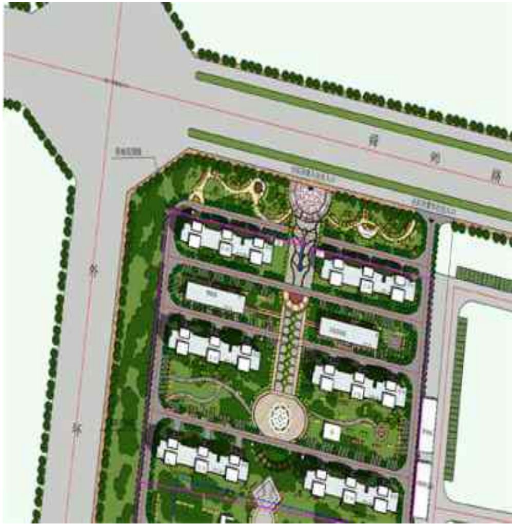
图 3-2 项目平面布置图