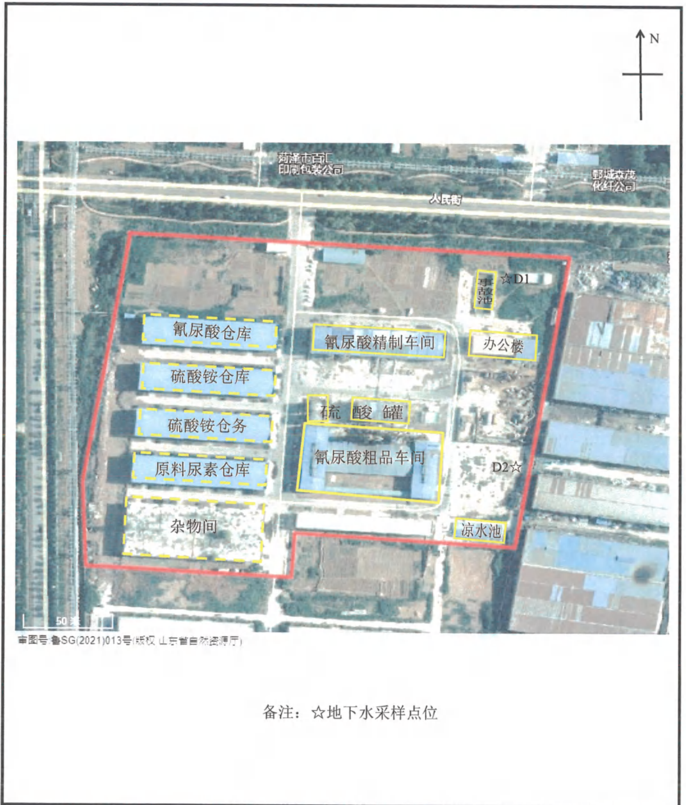
附图 1：厂区平面布置及布点示意图（菏泽华意化工有限公司东厂区）